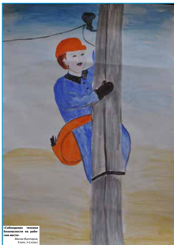
«Соблюдение техники безопасности на рабочем месте» Мычко Викторил, 9 лет, 3-й класс