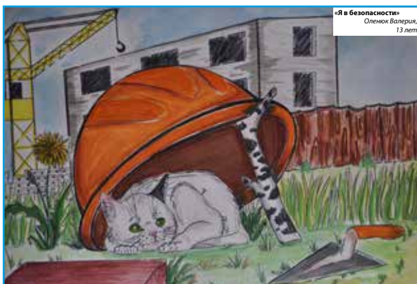
«Я в безопасности» Оленюк Валерия, 13 лет